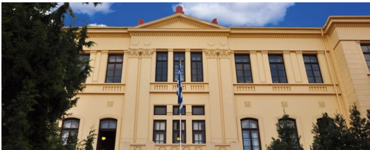
Университет имени Аристотеля в Салониках.