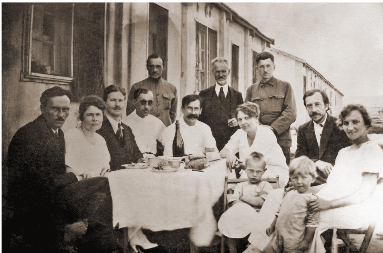
Русские эмигранты в Харилау. Конец 1920-х годов. Публикуется впервые.