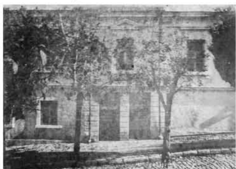
Дом на ул. Адмиральской, 5, после капитального ремонта 1919 г., виден второй изолированный вход