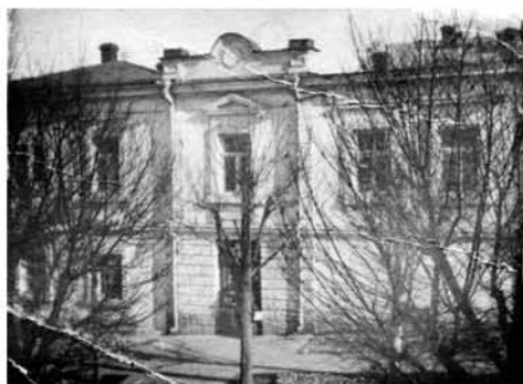
Дом Голубиновых на ул. Адмиральской, 5, фото до 1919 г