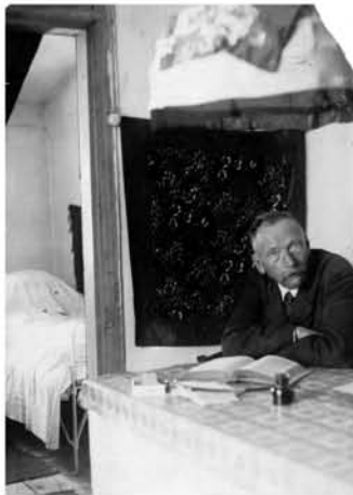
Е.П. Голубинов в последние годы жизни