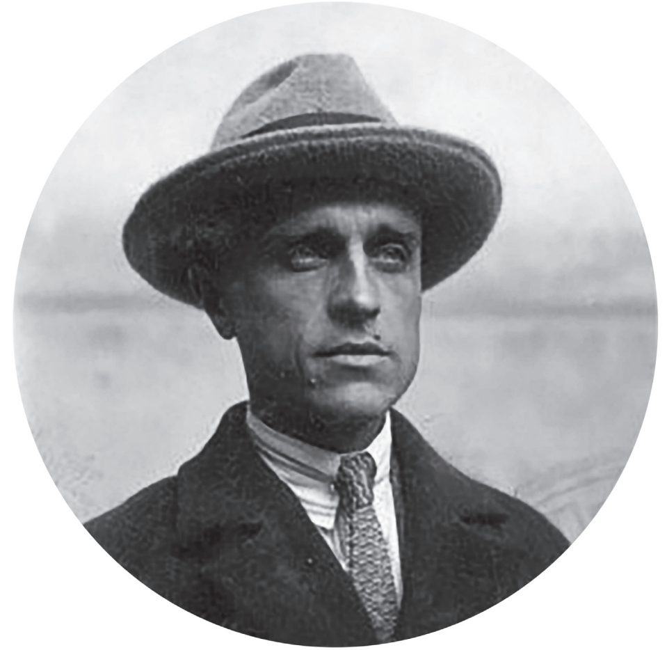
П. И. Чернявский. 1927 год. Государственный архив Сербии. Г–183. F-IV-37

ми академии стали 9 представителей русского зарубежья (Сорокина 2019: 235). Среди них был Павел Иванович Чернявский (1892–1969), первый палеоботаник и основатель данной отрасли ботаники в Югославии (Ђорђевић Милутиновић 2022), имя которого нет в списках членов академии, поскольку его исключили из состава академии в связи с советско-югославским конфликтом.