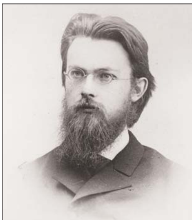
П.А.Столыпин и В.И.Вернадский в студенческие годы.

го — в дневниковой записи академика от 14 апреля 1938 г. Она приоткрывает неизвестный в историографии факт близкого знакомства в юности двух знаменитых в будущем известнейших людей России: «Виделся с Книповичем, старым другом на первом курсе естественного [отделения Петербургского университета] 1881 [года]. — записал Вернадский. — Тогда [мне были особенно близки] Оболянинов и он — кроме друзей по гимназии Краснова и Ремезова. Еще Столыпин, Шнитников — но это на 2-м курсе» [13].