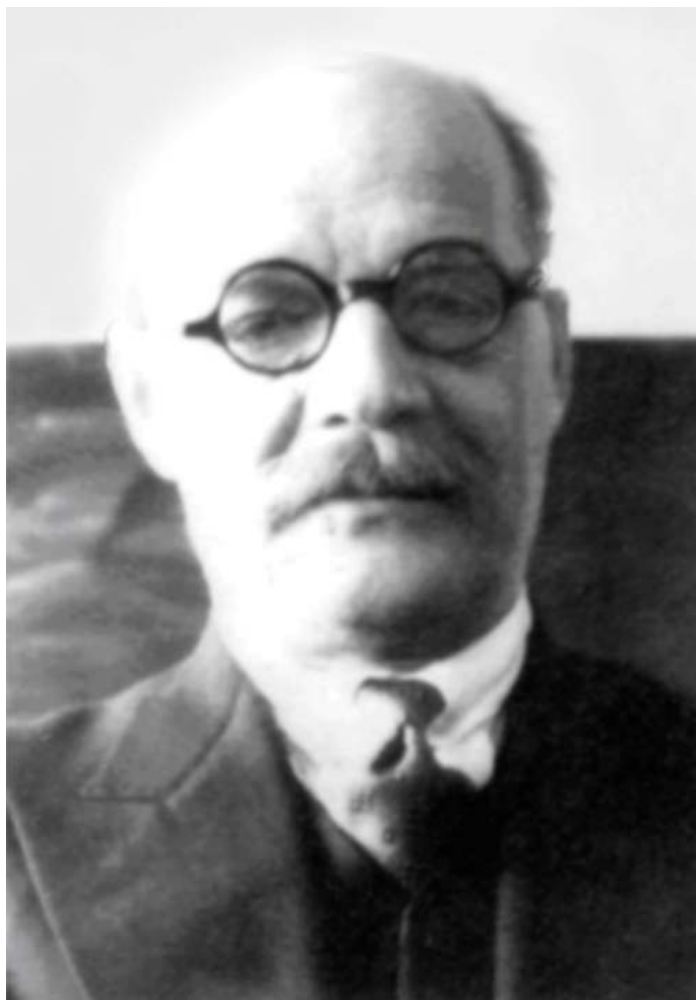
Пётр Владимирович Нестеров (25 мая 1883 – 8 июля 1941)

нились обстоятельства его гибели, то буквально «волосы встали дыбом». Захотелось разузнать об этом человеке всего как можно больше, и поиски были продолжены.