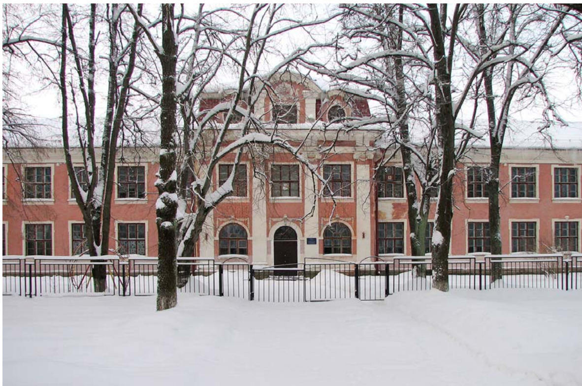
Современный вид здания бывшей Печорской гимназии, ныне школы-интерната. 4 января 2011.

тельно в 1910 году он закончил специальные курсы и получил право на преподавание в средних учебных заведениях, а в 1912 году сдал магистерские экзамены по избранной специальности.