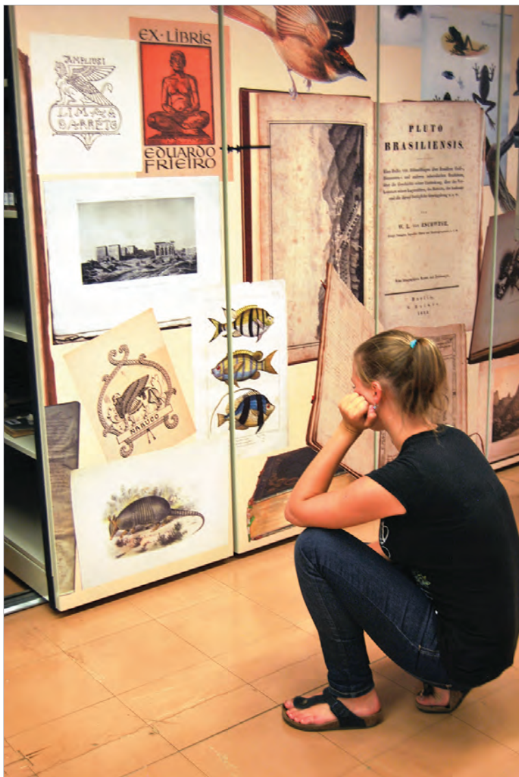
В библиотеке Федерального университета штата Минас-Жерайс, Белу-Оризонти, Бразилия

In the library of the Federal University, State of Minas Gerais, Belo Horizonte, Brazil