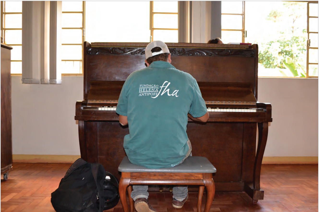
Играет воспитанник Фонда Елены Антиповой, Ибирите, Бразилия A Helena Antipoff Foundation alumnus playing. Ibirite, Brazil