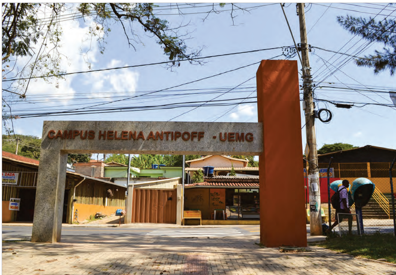
Кампус «Хелена Антипофф» Федерального университета штата Минас-Жерайс, Ибирите, Бразилия Helena Antipoff Campus of the Federal University, State of Minas Gerais, Ibirite, Brazil