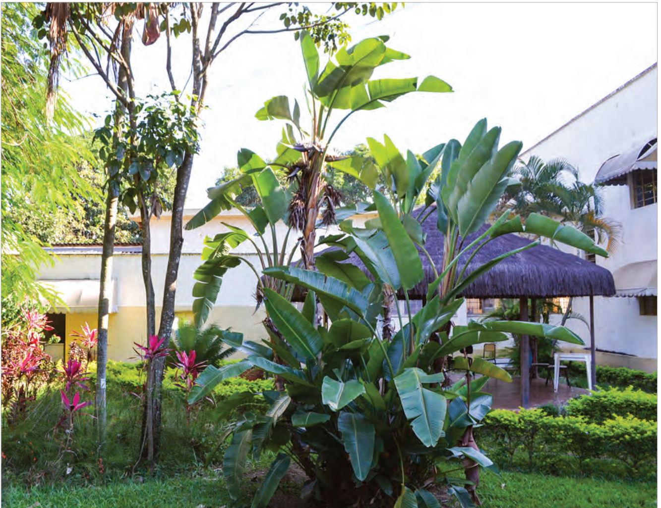
Фонд Елены Антиповой. Современный вид Helena Antipoff Foundation. Current view

And yet life in comfortable Geneva was far from idyllic. Ms. Antipoff's letters of the time are full of bitter confessions. July 19, 1926, "Was going to 'jump in the river' <...>, end of year – weary of life, failures from lack of stamina"; 18 November 20, 1926, "I am writing to you on the postcard because I did not have enough money to send a letter.... I get monstrously tired working, having trudged home I lie flat on my back for an hour or so before doing anything else. I have lost weight and look years