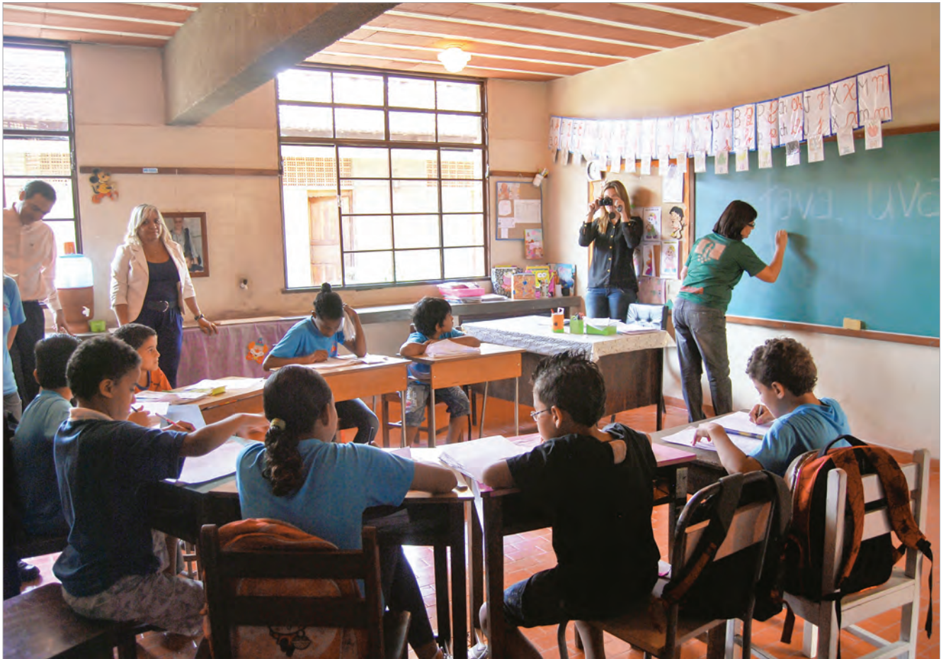
Воспитанники Фонда Елены Антиповой. Ибирите, Бразилия Alumni of the Helena Antipoff Foundation. Ibirite, Brazil