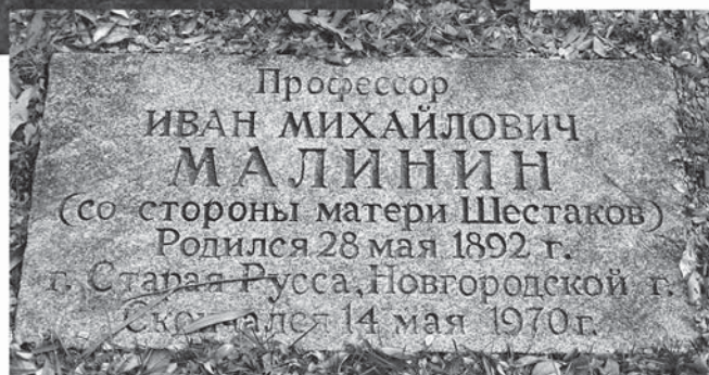
Могила И.М. Малинина на кладбище Рок-Крик (Вашингтон, округ Колумбия, США).